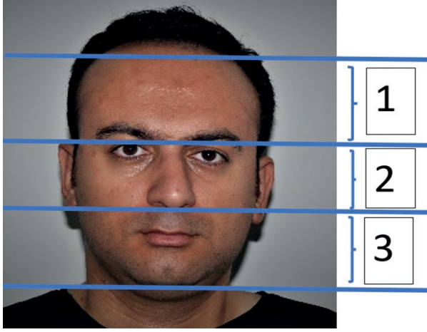
Şekil 2. Yüzdeki Üç Bölge

Yüz ifadelerindeki duyguları analiz edebilmek için yüzün üç bölgesindeki kasların gözlenmesi gerekmektedir. Ekman ve Friesen (1975) tarafından ileri sürülen yaklaşıma göre yüzün analiz edilmesindeki üç bölge Şekil 2.'de görülmektedir.